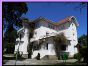
Casa de Cultura

3. CASA DE CULTURA: vivienda realizada de forma casi consecutiva a la Escuela-Casa Consistorial. Declarado Bien de Interés Local, con categoría de Inmueble. Combina Modernismo y Eclecticismo.