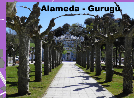
Alameda - Gurugú