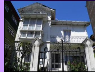
Casa Caviedes - Inastrillas

8. CASA CAVIEDES-INASTRILLAS: vivienda modernista del siglo XIX. Vivienda característica de la burguesía de la época, con amplio jardín.