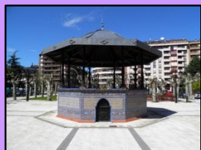
Kiosco de Música

5. VILLA AMELIA: vivienda neoclásica de finales del siglo XIX, con influencias pintoresquistas.