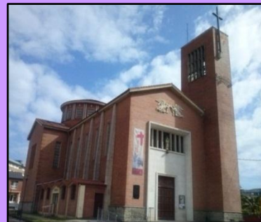
Iglesia del Carmen

10. CASA CAYÓN: casona del siglo XVIII, de estilo Barroco Montañés.